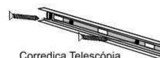
Corrediça Telescópica Parafuso 3,5x14